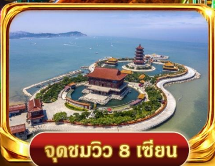
จุดชมวิว 8 เขียน