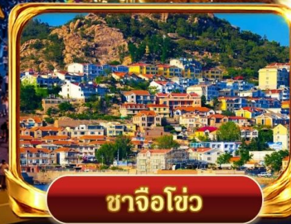
ซาจิวโซ่ว