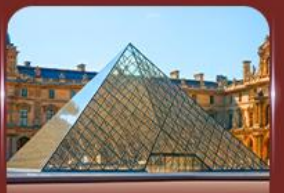
เข็ควินพิพิธภัณฑสถานลูฟวร์ ปารีส