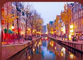
ย่าน Red Light อัมสเตอร์ดัม