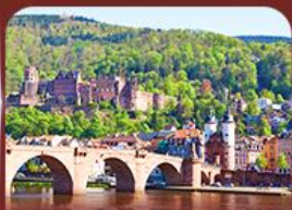
ชมเมืองสวย ไฮเดลเบิร์ก