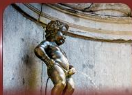
manneken pis บรัสเซลส์