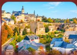
ย่านเมืองเก่า ลักเซมเบิร์ก