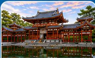
วัดเบียวโดอิน เมืองอูจิ