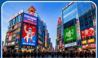
ช้อปปิ้งย่านชินไซบาชิ โอซาก้า