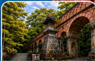
วัดนินเซ็นจิ เกียวโต