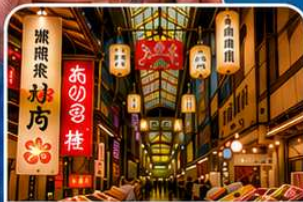
ตลาดปลานิชิกิ เกียวโต