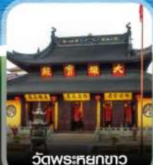
วัดพระศกขาว