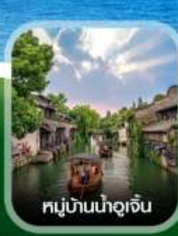
หมู่บ้านน้ำอู๋เจิน