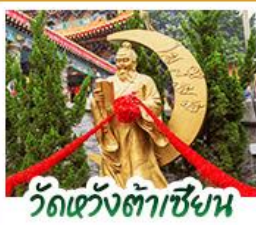
วัดเข่งต้าเซียน