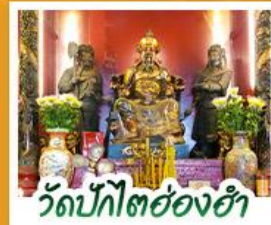
วัดปึกโตย่องฮา