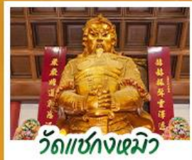
วัดเข่งเหมียว