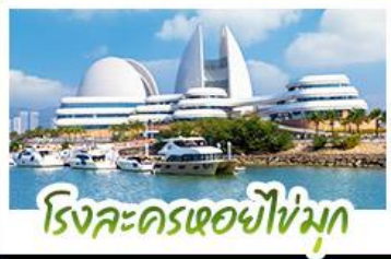
โรงละครเซียวไห่หมุก