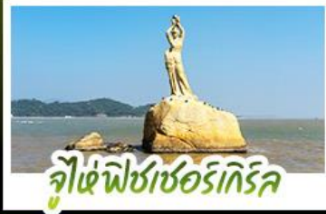
จูไห่ฟิชเชอร์เกิร์ล

ดื่มคำบรรยายที่สุดคลาสสิกสไตล์อังกฤษ ณ THE LONDONER MACAO ไหว้พระ-ตั้ง 3 วัดตั้ง ขอพรการทำงาน การเงิน ความรัก ครอบงำในรูปเดียว ชมความวิจิตรตระการตาของพระราชวังหยวนหมิงหยวนใหม่แห่งจูไห่ ช้อปปิ้งจุใจ ย่านจิมซาจุ่ยและถนนคนเดินฟู้ทวอลล์