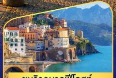
ชมวิวมอลฟีโคสก์