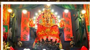
วัดแซกทงเหมียว