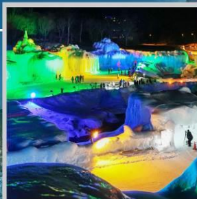
“SOUNKYO ICE FEST”