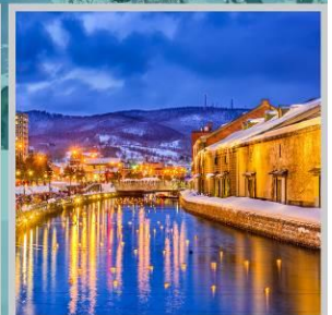
“OTARU CANAL FEST”