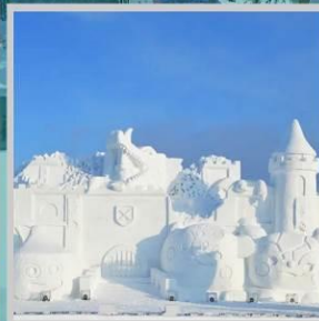
“ASAHIKAWA SNOW FEST”