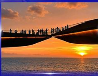
สะพานจวบ Sunset Town