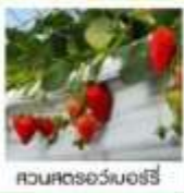
สวนสตรีเวอร์รี่