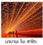
นาามะ โนะ ซาโตะ