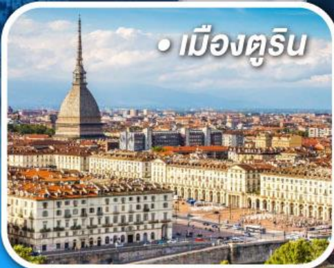
• เมืองตูริน