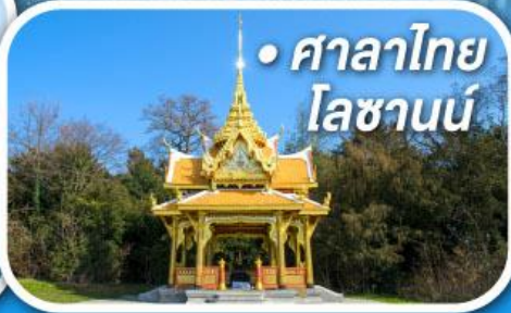
• ศาลาไทย โลซานน์

• สุดอากาศดีที่เซอร์แมท • ขึ้นกระเช้าสู่ยอดจากลาเซียร์ 3000 • ชมเมืองคลาสสิกเบิร์กึน ลูเซิร์น ซูริก