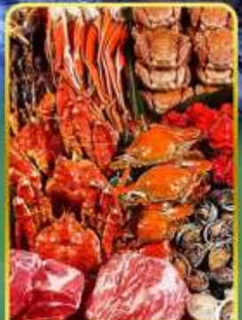
ปิ้งย่างพรีเมียมมันตะ

ออนเซ็น 2 คั้น มน.กระเป๋า 1 ใบ 23 กก 7Days 5Night