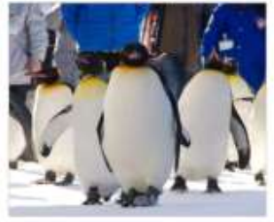
ชมพาเหรดแพนกวิน