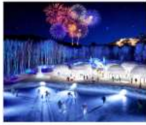
หมู่บ้านน้ำแข็งโทมามู