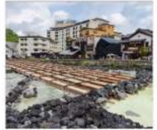
ชมยูบะทาเทะคุสึทสึ