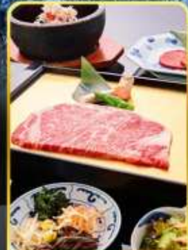
ปิ้งย่าง ROKKASEN

ออนเซ็น 3 คั้น มน.กระเป๋า 1 ใบ 23 กก 9Days 6Night