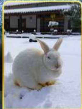
หมู่บ้านกระด่ายคางะ