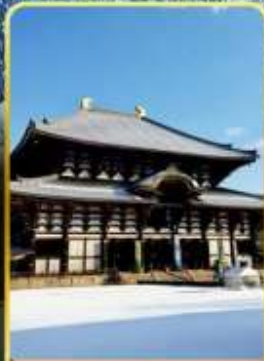
นาราโกไดจิ

พิเศษพักในเมืองคุสัทสึออนเซ็นพร้อมชมยูบาคาเกะ