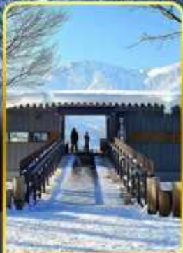
ฮาคุบะอิวาตาคะ