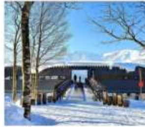
นั่งกระเช้าฮาคุมะ