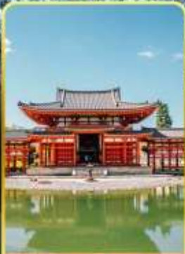
วัดเมียวโอดิน