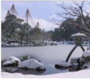
สวนเดนมะรุคเซ็น