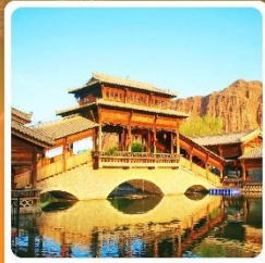
เมืองเล็กตันเสี่ยโซ่ว