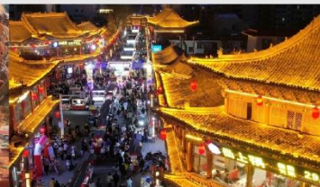
ตลาดกลางคืนจางเย่

*ทางบริษัทฯ ขอสงวนสิทธิ์ในการสลับโปรแกรมทัวร์ตามความเหมาะสมขึ้นอยู่กับสถานการณ์หน้างาน โดยคำนึงถึงผลประโยชน์ของลูกค้าเป็นสำคัญ