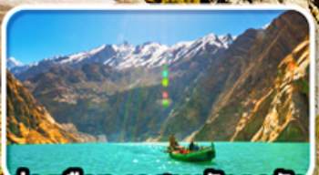
หุบเขาฮุนซาสวรรค์แห่ง เทือกเขาคาราโครัม