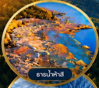
ธารน้ำห้ำสี