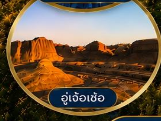
อู่เจ้อเซ่อ