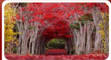
สวนลับชิราโอกะ