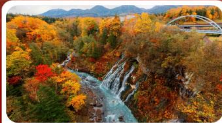
น้ำตกชิราฮิเกะ