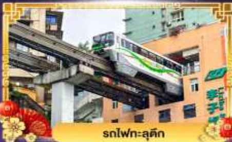
รถไฟฟ้า-ลูตติก