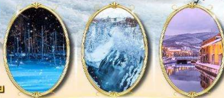
Shirogane Blue Pond Illumination Shirahige Waterfall Otaru Canal