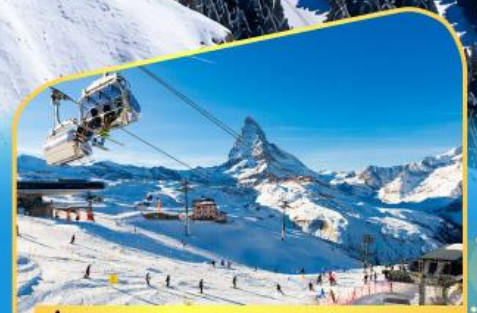
นั่งกระเช้าชมแมทเทอร์ฮอร์น