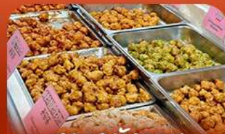
ตลาดม้งวอน