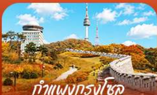
ทำแพนกรงโซลแบบบอมบ์แควร์

ออกเดินทางสู่ร่องราวแห่งฤดูใบไม้เปลี่ยนสี สัมผัสความงดงามของเกาะบาบิและอุทยานแห่งชาติชอริคซาน เพลิดเพลินกับความสนุกเต็มอิ่มที่สวนสนุกเอเวอร์แลนด์ • เก็บภาพความประทับใจท่ามกลางทุ่งหญ้าสีทอง และใบไม้หลากสีที่สวนฮานิลปาร์ค • พร้อมชมวิวหอคอยนิทานจากแบบอนิเมะ • เต็มเต็มความสุข ด้วยการลิ้มลองสตรีทฟู้ดรสเลิศที่ตลาดบึงวอน • ก่อนเพลิดเพลินกับการช้อปปิ้งในกรุงโซลตลอดทริป