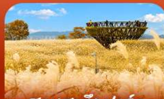
สวนฮานิลปาร์ค