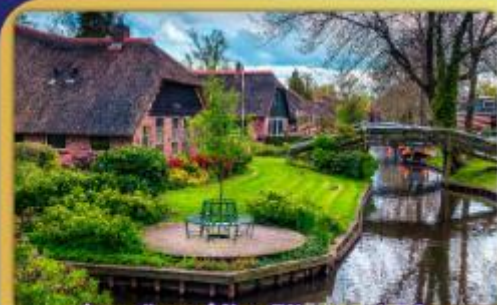
ล่องเรือหมู่บ้านไรทอนท์ธูร์น