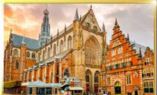
จัตุรัสเมืองฮาร์ลิม

พรมแดนเมืองแปลกเนเธอร์แลนด์และเบลเยียม เดินเมืองเคลฟท์ เมืองเครื่องปั้นดินเผาระดับโลก ฮาร์ลิมเมืองมั่งคั่งที่สุดของเนเธอร์แลนด์