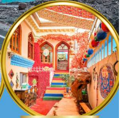
เมืองเก่าคัชการ์