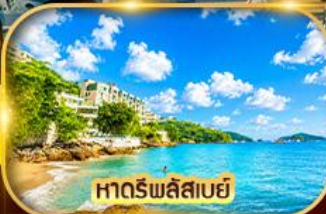
หาดริพลีสเบย์