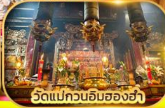
วัดแม่กวนอิมสองห้า