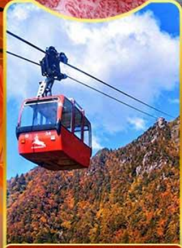
นั่งกระเช้าโกโซโซ