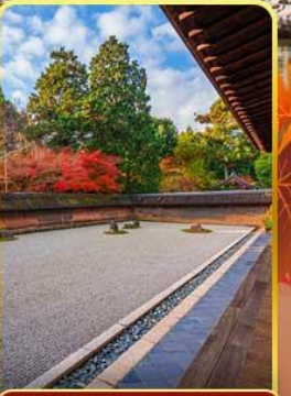
วัดเรียวอันจิ