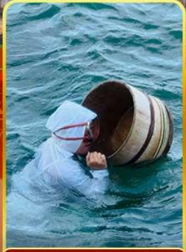
เกาะไข่บุก (โซวามะ)