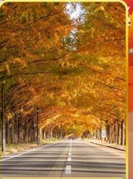
เมตาเซควอยานามิกิ

ออนเซ็น 3 คั้น นบ.กระเป๋า 1 ใบ 23 กก. 7Days 5Night