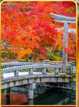
วัดเออิทังโง