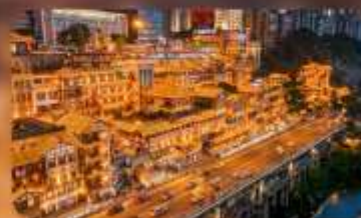
หงหย่าตั้ง