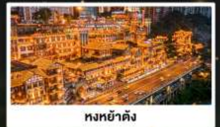
หงหย่าตั้ง