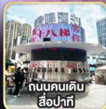
ถนนคนเดิน สือปาตี