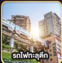
รถไฟฟ้าชุกติ๊ก