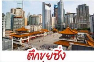
ตึกขุยซิง

พระแกะสลักหินต้าจู้ - หลุมฟ้าสะพานสวรรค์ - เขานางฟ้า ตึกขุยซิง - ตึกตะเกียบ หมู่บ้านโบราณฉือซีหัว