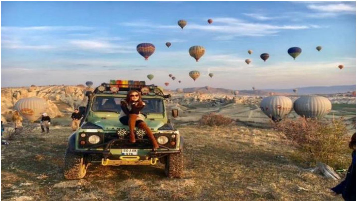
3. Classic Car นั่งรถคลาสสิค เปิดประทุน สูดอากาศ เย็น สดชื่น พร้อมชมบอลูนสีสดใส วิวเมืองคัปปาโดเกีย ค่าใช้จ่าย 120 USD / ท่าน