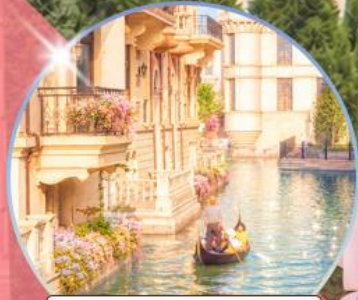
เวนิส เมืองต้าเหลียน