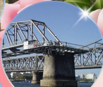
สะพานขาดตานตง