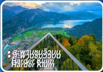
• สะพานชมวิวยอด Harder Kluem