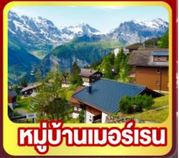
หมู่บ้านเมอร์สเรน