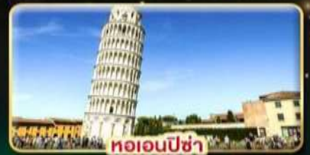
หออนปีซ่า